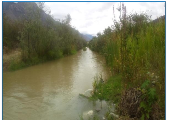
En esta vista se aprecia el cauce colmatado del río Huancabamba, donde podemos apreciar bastante vegetación en ambos márgenes, y en la bocanoma rústica del canal lateral Montegrande, donde se recomienda descolmatar su cauce y se continúe con el regadillo a sus cultivos