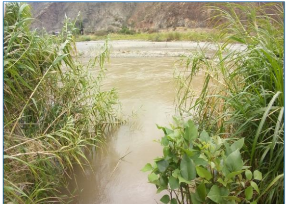
En esta vista se aprecia el cauce colmatado del río Huancabamba, donde podemos apreciar bastante vegetación en ambos márgenes, y en la bocanoma rústica del canal lateral El Alumbro, donde se recomienda descolmatar su cauce y se continúe con el regadillo a sus cultivos