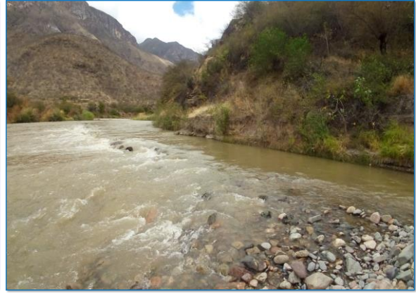
En esta vista se aprecia, en canal lateral La grama, donde su caja hidráulica se ha colmatado con presencia de roca del mismo río Huancabamba, podemos apreciar que su caja hidráulica de bocanoma se encuentra en mal estado