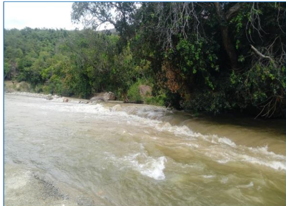
En esta vista se aprecia el cauce colmatado del río Huancabamba, donde podemos apreciar bastante vegetación en ambos márgenes, y en la bocanoma rústica del canal lateral Chichagua, donde se recomienda descolmatar su cauce y se continúe con el regadillo a sus cultivos.