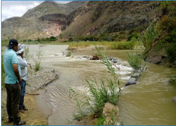
En esta vista se aprecia el cauce colmatado del río Huancabamba, donde podemos apreciar bastante vegetación en la bocanoma rústica del canal lateral El Naranjo, donde se recomienda descolmatar su cauce