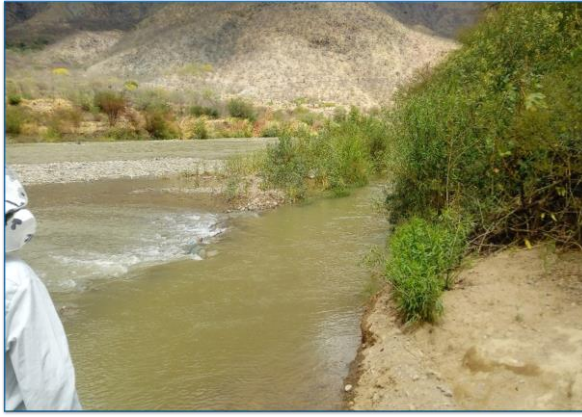
En esta vista se aprecia el cauce colmatado del río Huancabamba, donde podemos apreciar bastante vegetación en el cauce y de la bocanoma del canal lateral la Grama, donde se recomienda descolmatar su cauce